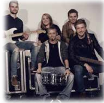
„RotzFrech“ – die junge Coverband