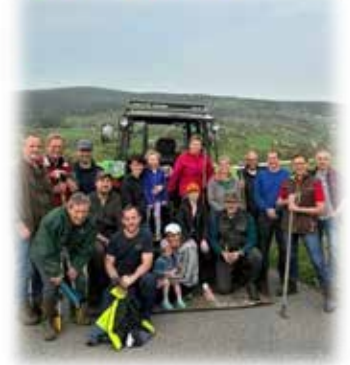
Bachpaten: Rehberger Schützen und Jäger